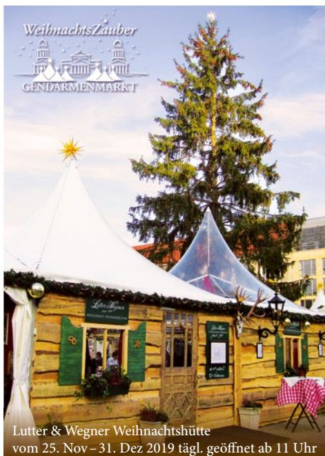
Lutter & Wegner Weihnachtshütte vom 25. Nov – 31. Dez 2019 tägl. geöffnet ab 11 Uhr