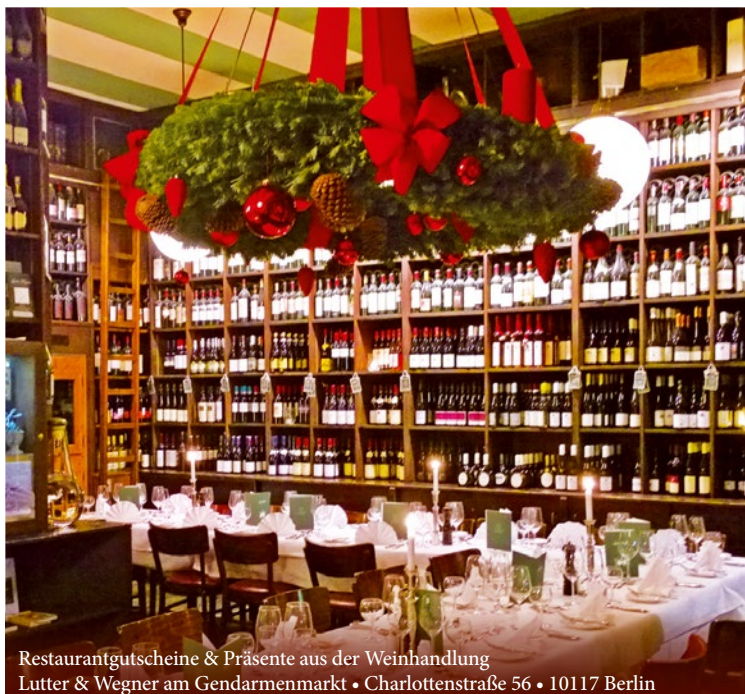
Restaurantgutscheine & Präsente aus der Weinhandlung Lutter & Wegner am Gendarmenmarkt • Charlottenstraße 56 • 10117 Berlin