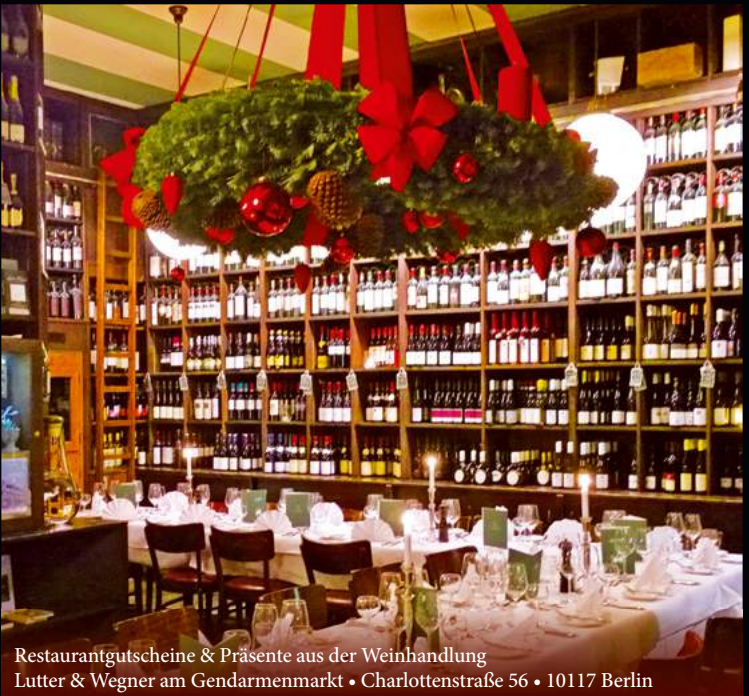
Restaurantgutscheine & Präsente aus der Weinhandlung Lutter & Wegner am Gendarmenmarkt • Charlottenstraße 56 • 10117 Berlin