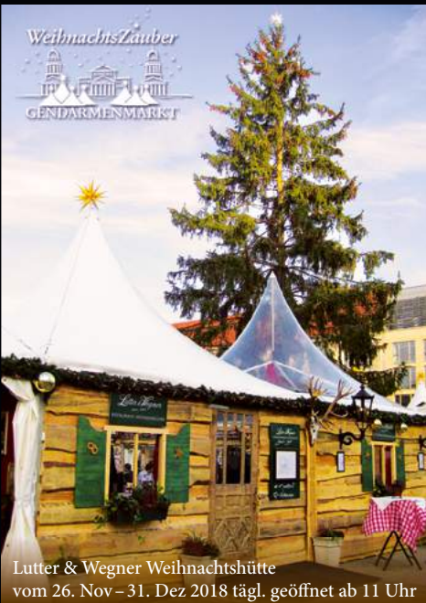
Lutter & Wegner Weihnachtshütte vom 26. Nov – 31. Dez 2018 tägl. geöffnet ab 11 Uhr